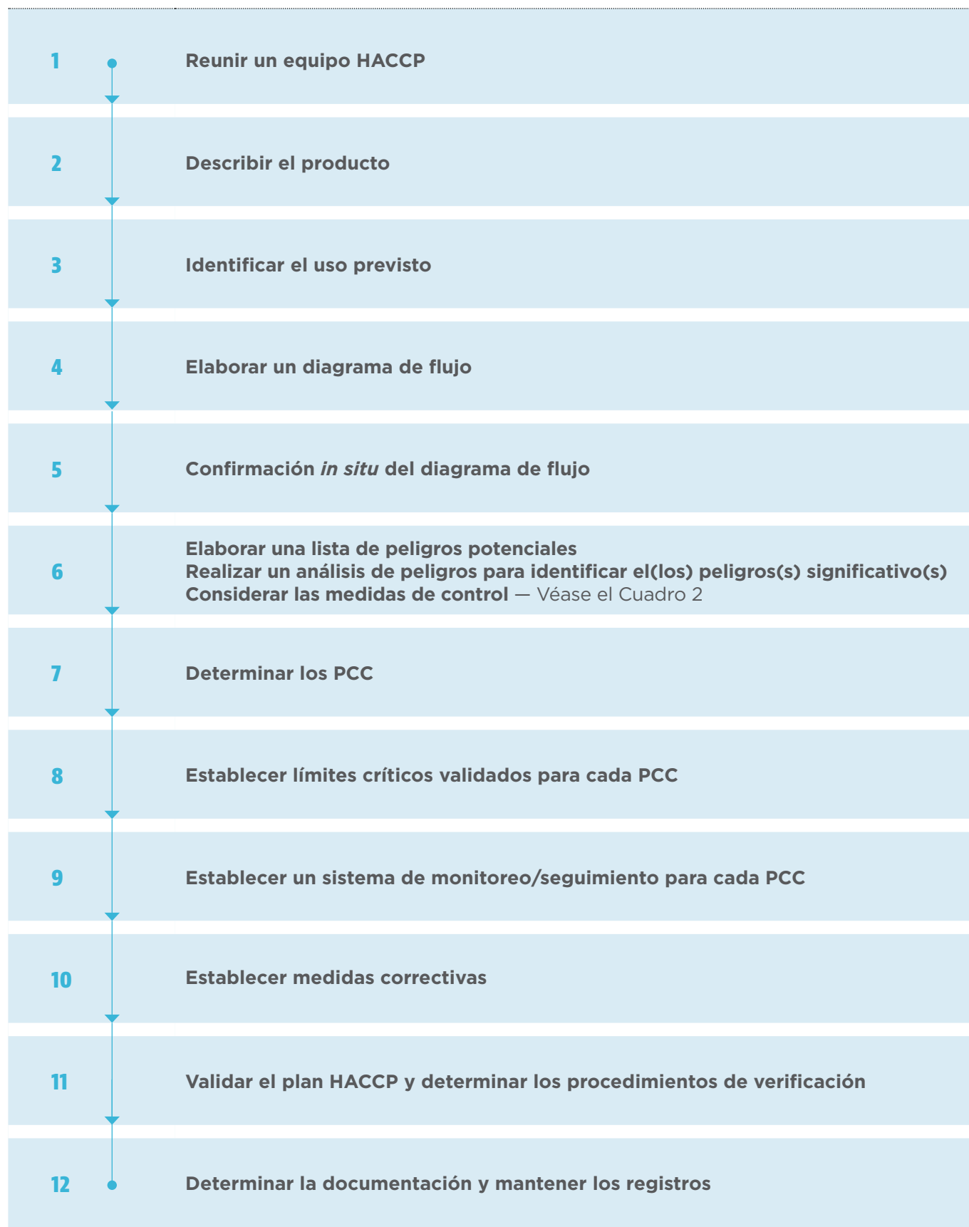
Figura 1 Secuencia lógica para la aplicación del HACCP